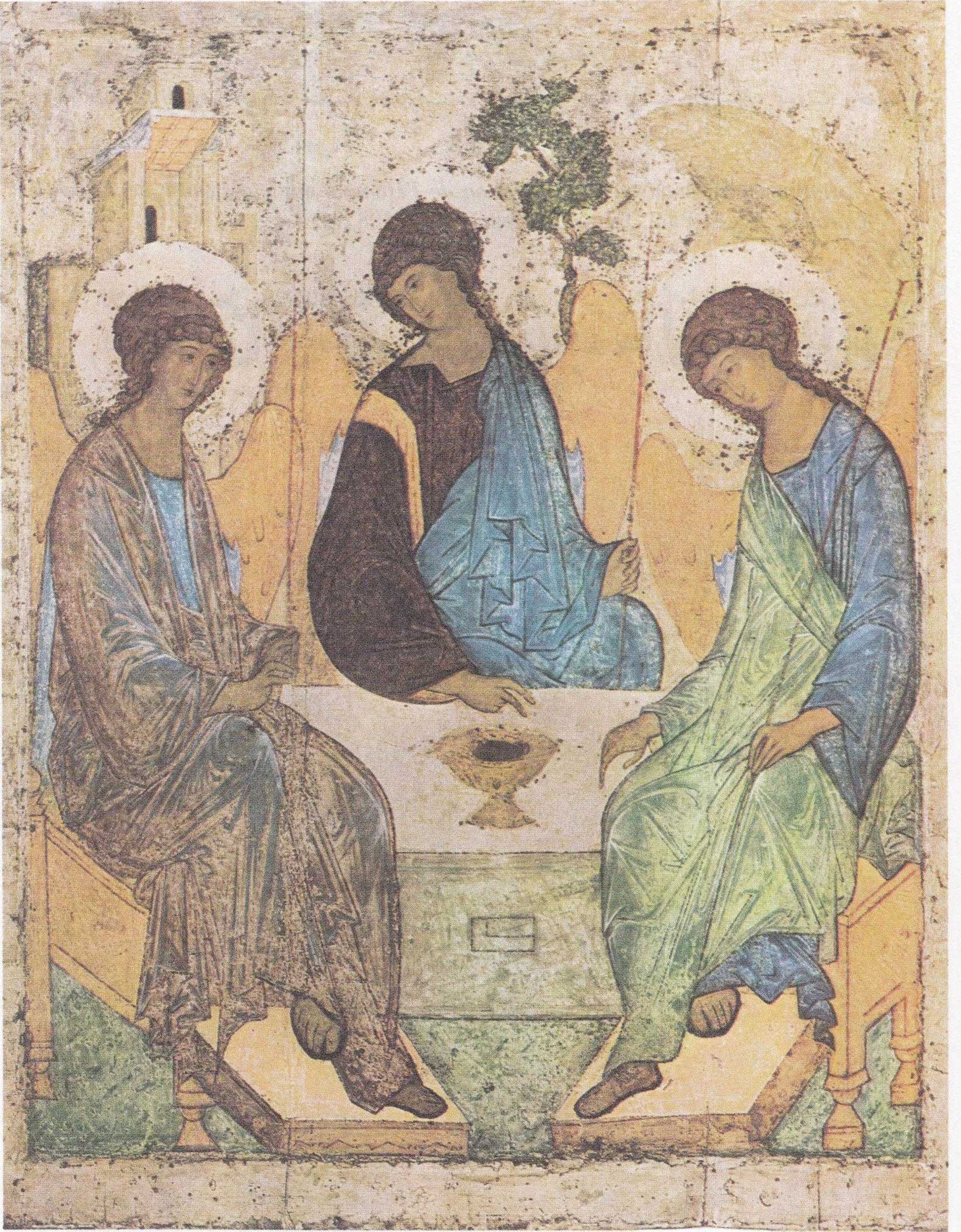
إيقونة الثالوث الأقدس

للرسّام الروسي أندريه روبليف (حوالي ١٤١٥) محفوظة في غاليري تربيتيا كوف - موسكو