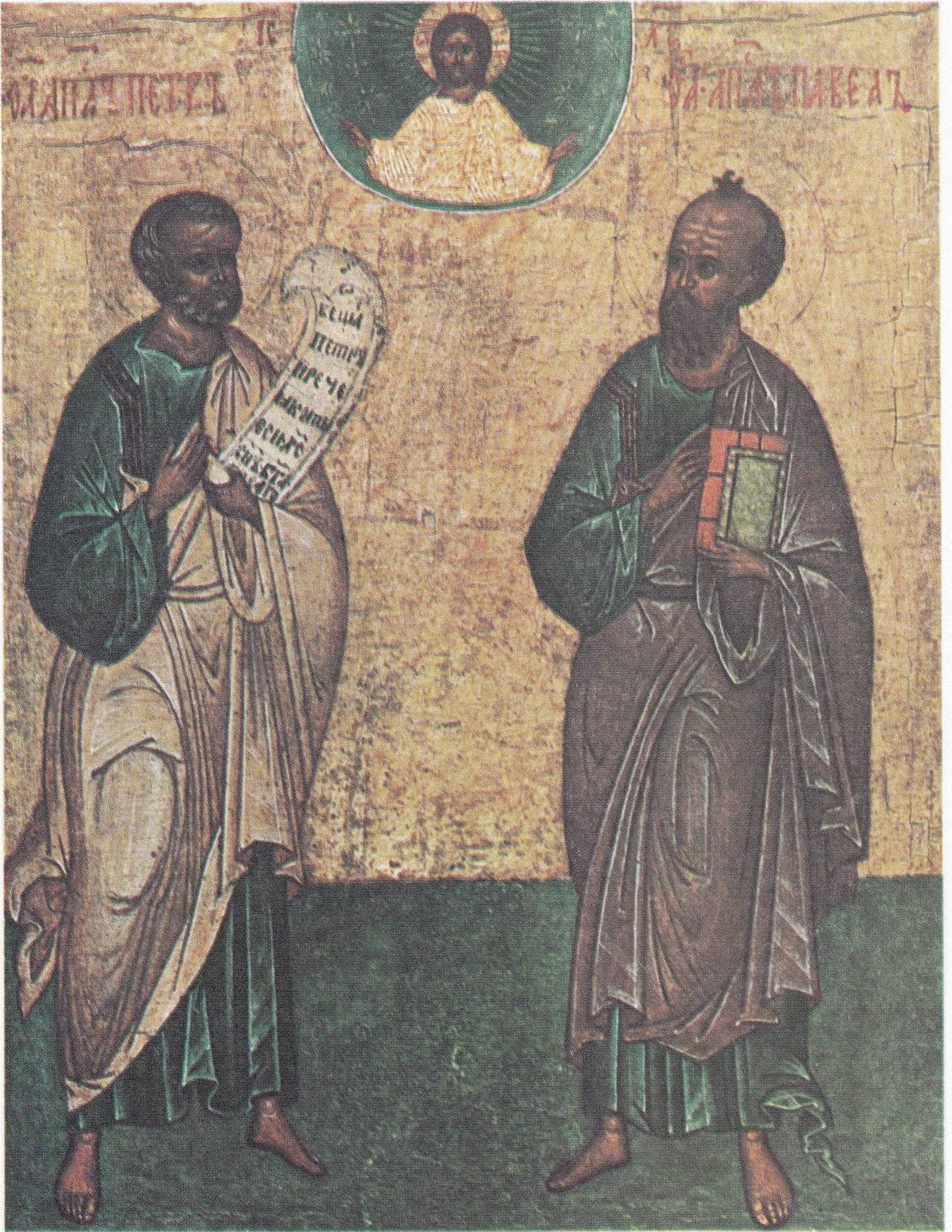
زعماء الرسل بطرس وبولس وركناء الكنيسة (إيقونة روسية من أوائل القرن ١٦)